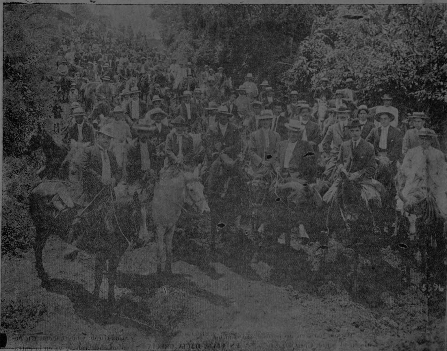
Una cabalgata de más de doscientas cincuenta personas vino a encontrar al señor Presidente cerca del río Prendas, y lo acompañó hasta la culta ciudad de Grecia. La presente fotografía fue tomada por nuestro fotógrafo especial en la excursión, don Manuel Gómez Miralles. Un diario que se ha significado por su oposición sistemática al Gobierno actual, preguntaba ayer mismo: "¿A qué va el señor Presidente a Grecia? ¿Quién lo recibirá?!" Esta vista, obtenida por nuestro fotógrafo, es la contestación más elocuente y demostrativa para los adversarios.